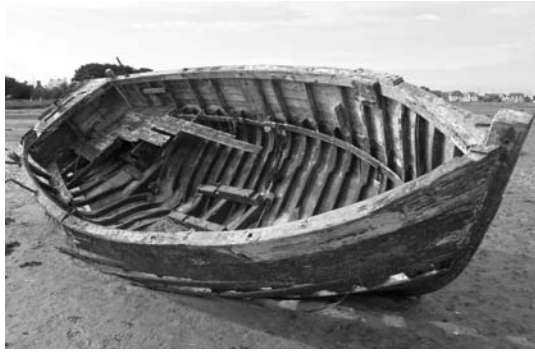
L'épave en 2008