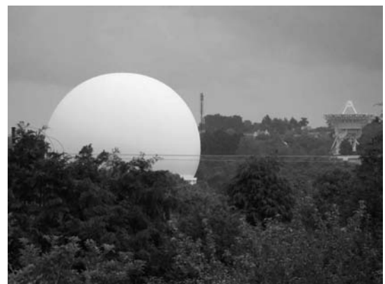
Le radôme de Pleumeur-Bodou.

La grosse boule, le "radôme", abritait la grande oreille (antenne cornet) qui écoutait les premiers satellites de télécommunication. Le pylône métallique, rouge et blanc, d'une hauteur de 200 m comportait un émetteur destiné à caler l'azimut (l'orientation) de la grande oreille.