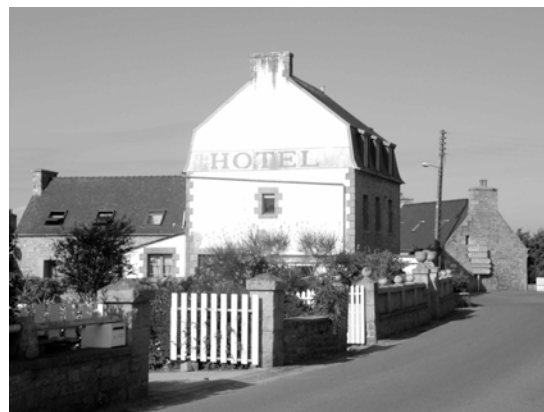
L'Hôtel de Bretagne