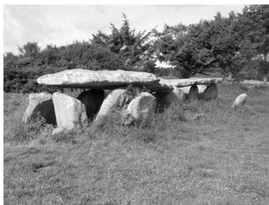
Le Dolmen aujourd'hui.

Il n'est pas bien difficile d'imaginer comment les néolithiques ont construit le dolmen. Le granit du Ty Gward présente des failles et une stratification dues à l'érosion particulièrement favorable à l'extraction de dalles. Des coins de bois sec, enfoncés dans les fissures à coup de masse étaient ensuite mouillés ; ils gonflaient et faisaient éclater la roche.