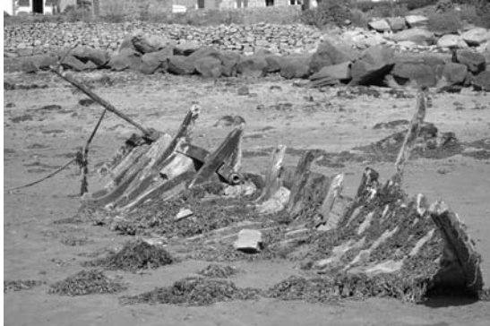
L'épave en 2018. Sic transit gloria mundi...