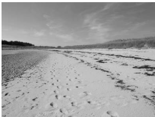
Exemple typique de laisses de mer.

Après chaque forte marée de pleine et nouvelle lune, les vagues abandonnent sur le rivage ces "laisses de mer", où se mêlent algues mortes et débris variés. Si l'on excepte les boules de verre, flotteurs décrochés des filets des marins pêcheurs et très prisés comme décoration, (c'était avant l'invention du polystyrène !) on n'y rencontrait guère que des morceaux de filets et des bouts. Mais, parcourant le rivage, il était possible de constituer de véritables collections naturalistes. Les laisses de mer différaient d'une grève à l'autre, en raison de leur exposition au large et au vent.