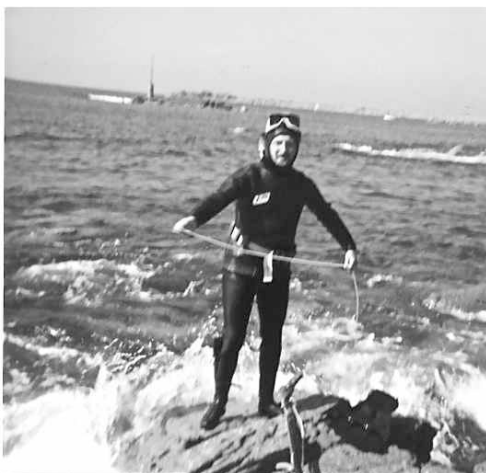
Retour de plongée (1984)

la vie sur nos côtes. Modeste plongeur en apnée, vêtu d'une solide combinaison "peau de requin", ces chasses se déroulaient dans 5 à 6 mètres de fond tout au plus. Le plus clair du temps était passé au tuba, en surface, entre deux eaux, à explorer les alentours.