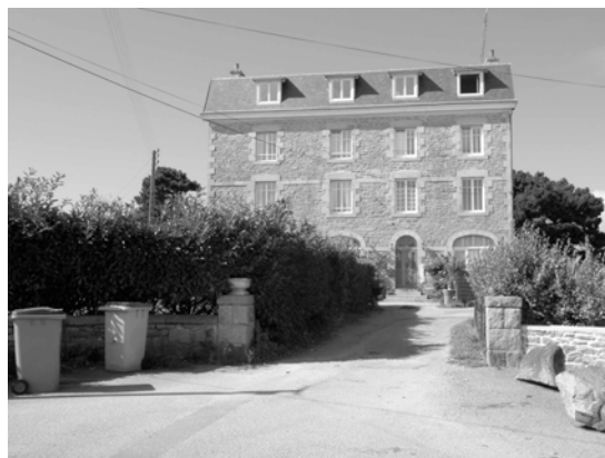
L'hôtel des Rochers

Bien entendu, le tourisme tendait à se développer au cours des décennies d'après guerre. Mais c'était un tourisme de nature très différente de celui d'aujourd'hui. Il existait deux hôtels sur l'Île : l'Hôtel des Rochers et l'Hôtel de Bretagne. Il leur fallait offrir des formules de pension complète car le touriste (l'estivant, comme disaient les Bretons) était en somme captif (mais consentant) de l'Île. Aussi venait-il au minimum pour deux semaines, le plus souvent pour un mois plein.