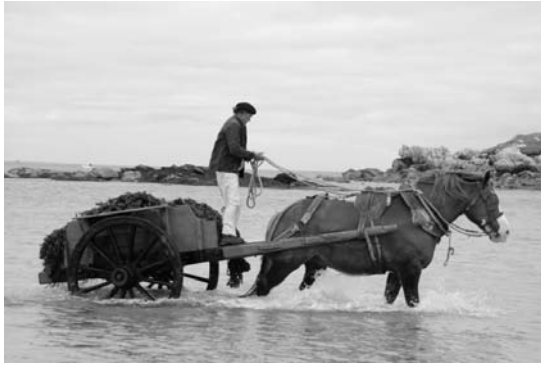
Ramassage du goémon.

Dans notre enfance, on pouvait quelquefois apercevoir les derniers goémoniers, ultimes vestiges du XIXe siècle. Vieille charrette de bois vermoulu tirée par un aussi vieux cheval, ils s'arrêtaient parfois vers Pors Gelen où ils chargeaient les algues abandonnées après une tempête ou une très grande marée.