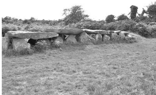
La très belle allée couverte de Prat ar Menhir, (ou Prajou Menhir) entre Penvern et Ile Grande.

On ne peut refermer ce chapitre sans rappeler également la splendide allée couverte située un peu avant l'entrée de l'île Grande.