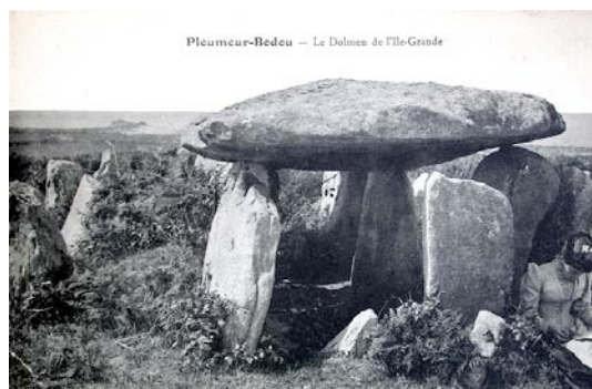
Le Dolmen...hier. Notez le costume de l'élégante en train de lire, en bas à droite.

d'études approfondies étendues à tout le mégalithisme européen 5 .