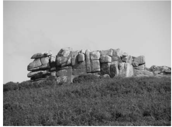
Point culminant d'Enez Veur, l'amas rocheux du "Corps de garde" (Ty Gward). L'abri des douaniers a disparu.

A la pointe d'Enez Vran, (l'île du Corbeau), le grand rocher Men Caezr semble un sphinx posé sur l'eau qu'il domine de 15 m à marée basse. Au loin, sur la gauche, le récif de "la Rieuse" (Ouerser) où se joue le dernier acte du pirate de l'île Lern.