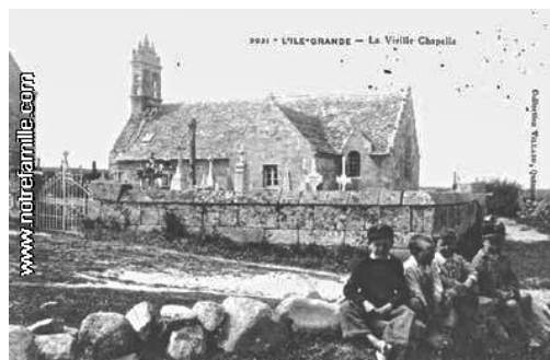
L'ancienne chapelle Saint-Sauveur

Lors de la démolition de l'ancienne chapelle Saint-Sauveur, Charles Le Goffic a récupéré quelques belles pierres qu'il a incorporées dans le balcon tourné vers la mer de sa maison de "Run Ruz" à l'entrée de Trégastel.