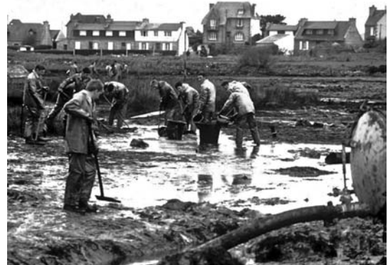
Polmar ! Grève entre Ker Jagu et Pors ar Bago. En arrière plan, Kichen ar Mor, la maison des Brinterc'h.

Mars 1978. Le pétrolier "Amoco Cadiz" s'échoue devant Portsall, se brise, et vomit son chargement. Marées, vents et courants poussent ce poison vers l'est, vers les Côtes d'Armor. L'île Grande et ses environs qui forment un promontoire à l'est de la baie de Lannion reçoivent de plein fouet la marée pestilentielle. La nouvelle annoncée par la radio, reprise avec quelques images par la télévision, plonge tous les amoureux d'Enez Veur dans la consternation et le désarroi. Les congés scolaires de Pâques commencent à peine. Sans hésiter, avec ma femme et mon fils âgé de 5 ans, je quitte la région parisienne pour aller constater l'étendue de la catastrophe de visu . Dès les hauteurs de Pleumeur-Bodou l'air se charge de relents de pétrole. L'odeur s'intensifie tout au long de la descente vers Penvern pour devenir insoutenable parvenus à l'île Grande.