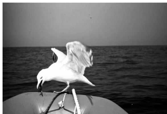
Clémentine, perchée sur le nez de Maringouin, au prises avec une queue de maquereau.

Trois années de suite, j'eus une compagnie inattendue pendant mes sorties. Surgissant de nulle part, un goéland atterrissait soudain sur le nez de Maringouin qu'il reconnaissait de loin, sans doute à sa couleur et à l'attrait des reflets argentés des poissons traînés dans le sillage.