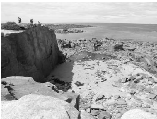
Une partie de la carrière de Jean Brinterc'h. A marée haute, une vraie piscine, dans laquelle les jeunes aiment plonger depuis le sommet de l'ancien front de taille.

les pierres extraites de sa propre carrière située à la droite de Pors Gwenn. Le front de taille impressionnant en bord de mer délimite une sorte de piscine naturelle à marée haute.